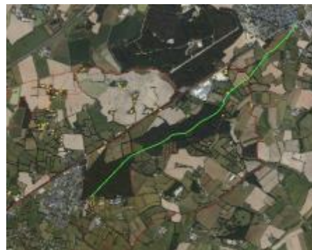
Voie verte cyclable vers Saint-Jean-de-Linières