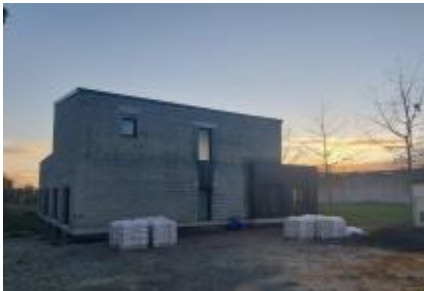
Chantier installation cabinet dentistes