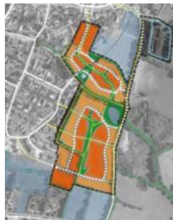
ZAC Moinerie Viabilisation tranche 2