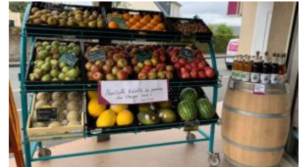
Changement de propriétaire supérette PROXI