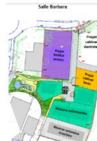
Permis d'aménager et viabilisation quartier Barbara