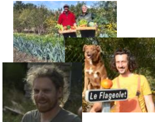
Démarrage projets de maraîchage